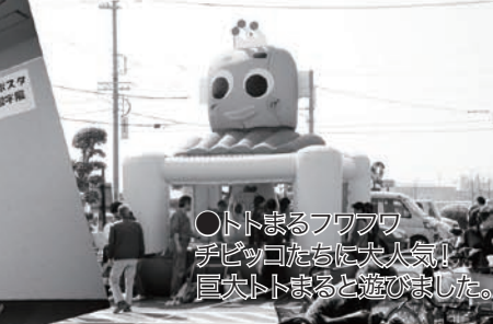
○トモまるフワフワ チビッコたちに大人気! 巨大トモまると遊びました。