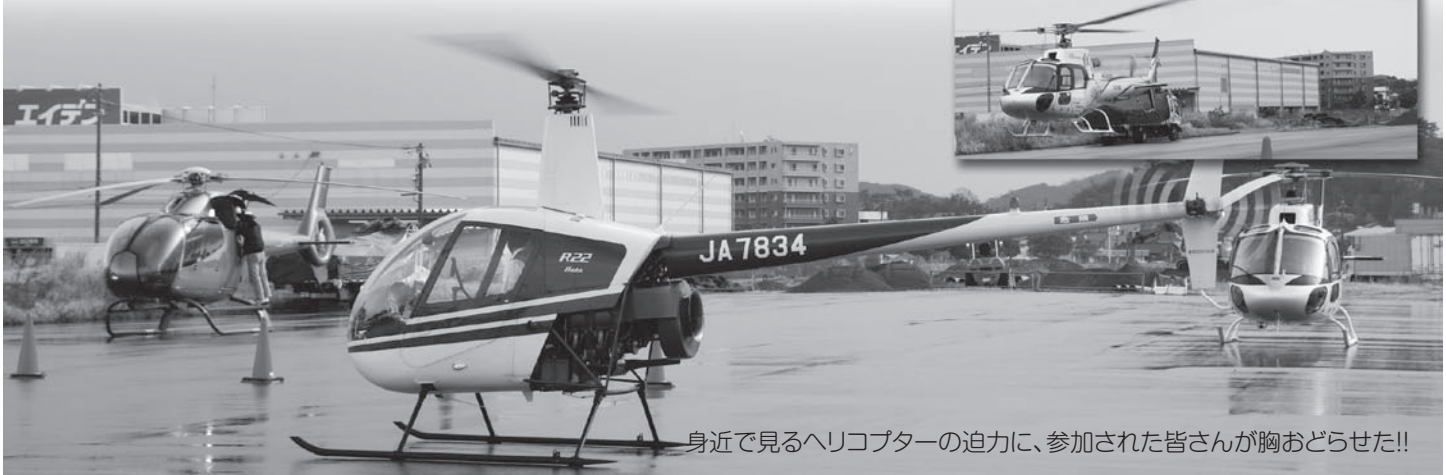
身近で見るヘリコプターの迫りに、参加された皆さんが胸おどらせた!!