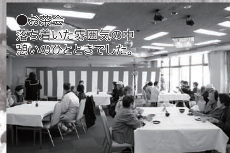
●お茶会 落ち着いた雰囲気の中 憩いのひとときでした。