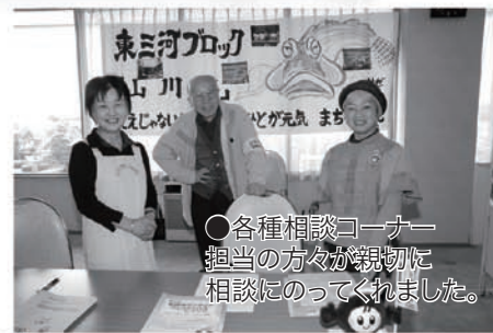
○各種相談コーナー 担当の方々が親切に 相談にのってくれました。