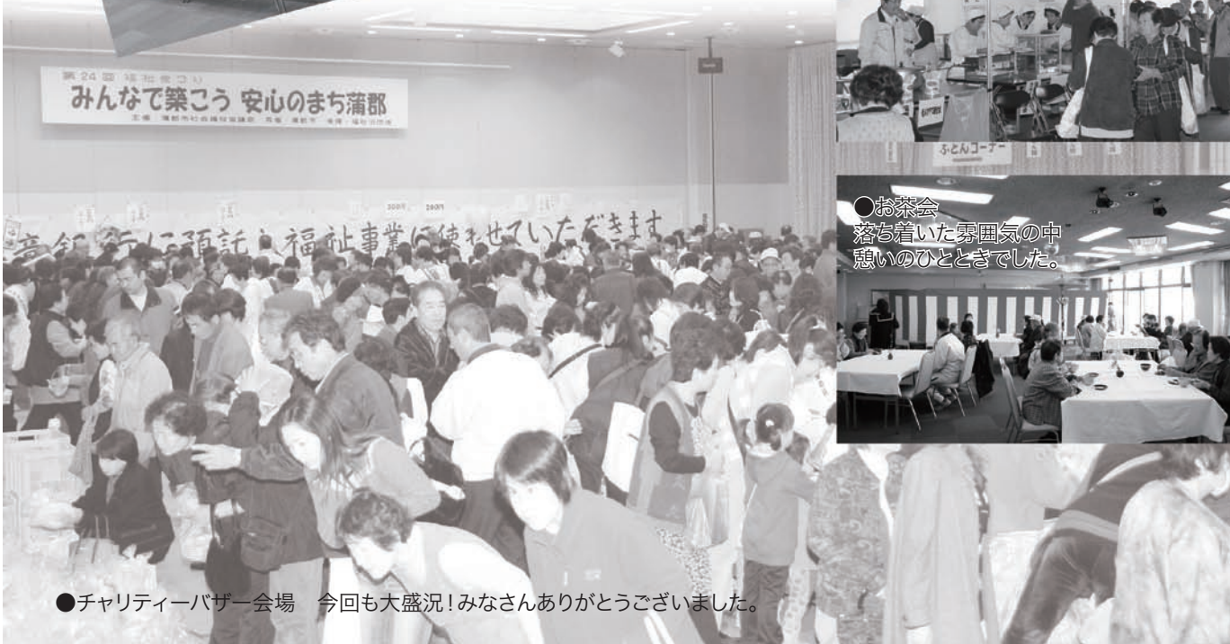
●チャリティーバザー会場 今回も大盛況! みなさんありがとうございました。