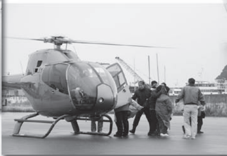
皆、「ドキドキワクワク」 ヘリコプターへさあ乗ろう