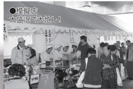
●模擬店 大盛況で大忙し!