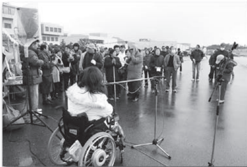
開会式の様子。 さあこれから空中散歩がはじまるぞ。

善意でヘリコプター遊覧を企業様から提供していただき、「ふれあいレクタイム」に参加された障がい児者の方々と交流をはかりました。