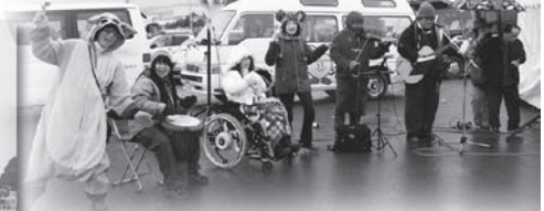
いつもありがとう。 キッチンガールズの演奏♪